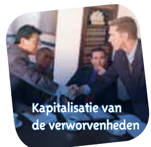
Kapitalisatie van de verworvenheden

Middelen toereiken aan uw medewerkers om snel operationeel te worden