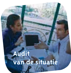
Audit van de situatie

Akteos biedt u advies, coaching en opleidingen en helpt u een actieplan op te zetten waarin de interculturele diversiteit van uw bedrijf verwerkt is. Door haar expertise en reactievermogen kunnen er aan uw specifieke verwachtingen voldaan worden.